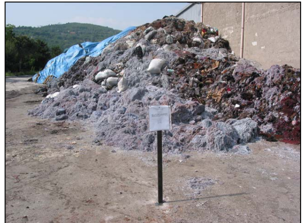
Accumulo di rifiuti derivanti da processi di rasatura delle pelli - Solofra (AV).