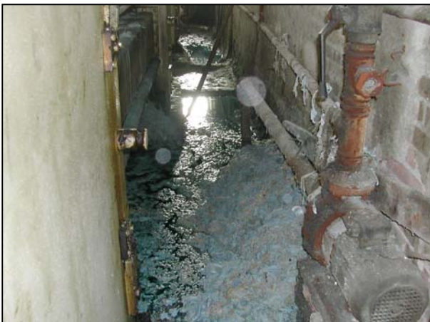
Accumulo di fango dovuto alla pressatura delle pelli - Santa Croce sull'Arno.