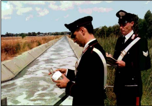
Campagna "CUOIO" - Carabinieri del C.C.T.A. in azione.