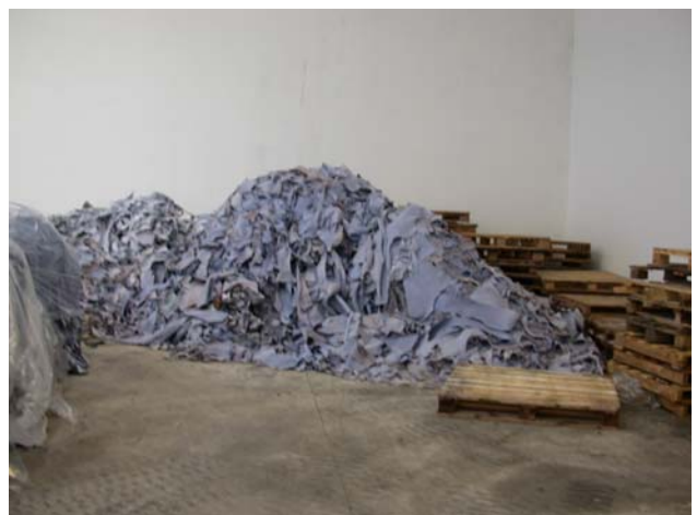
Scarti di rifilatura - Arzignano (VI).