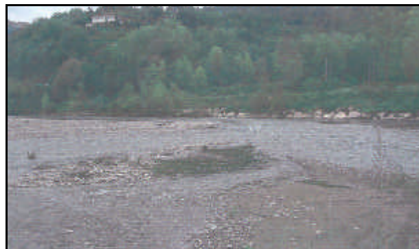
Confluenza nel fiume Magra Ligure