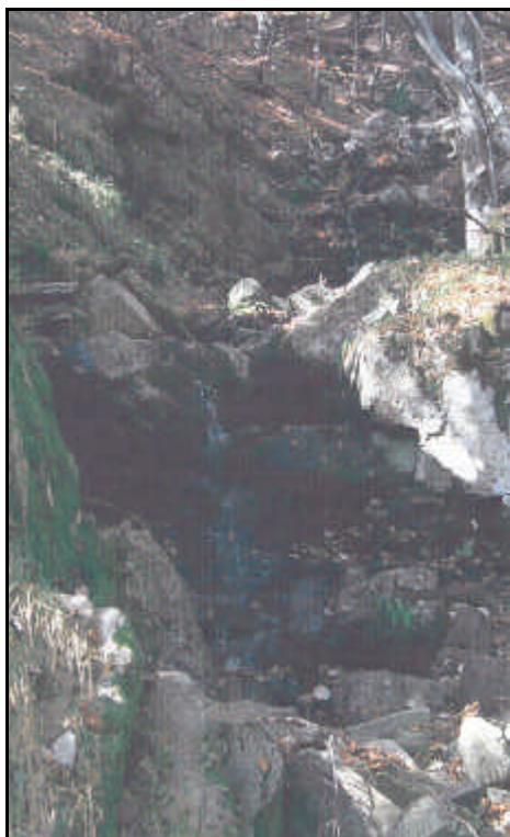
Sorgente del fiume Vara

Il corso inferiore del fiume, a valle di Ponte S.Margherita, presso il Sesta Godàno, è oggi interessato dall'unico Parco fluviale regionale, volto non solo alla tutela delle acque e di un ambiente eccezionale per la Liguria, ma anche al ripristino ambientale e paesaggistico della valle del Magra, utilizzata da decenni in maniera irrazionale e deturpante.