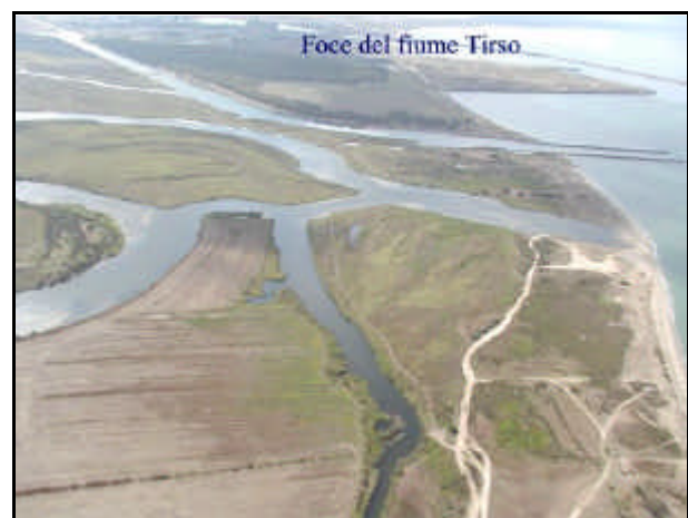
Foce fiume Tirso