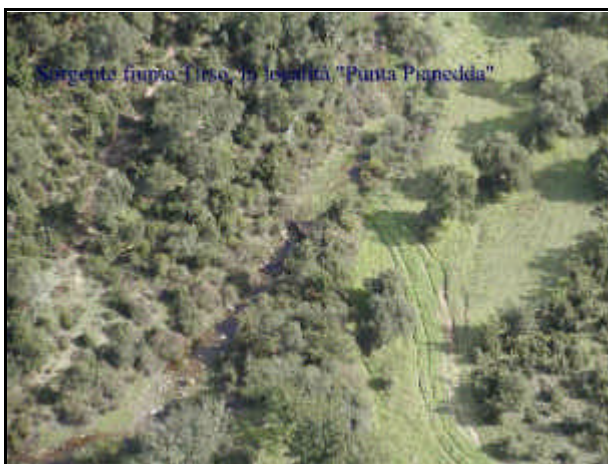
Sorgente fiume Tirso

Fiume della Sardegna, il più lungo dell'isola; 150 km; bacino: 3.375 km 2 . Nasce sull'altopiano granitico di Buddusò, a 800 m d'altezza; scende (dapprima con il nome di Riu de su Campu) attraverso il Goceano, con direzione NE-SO, ricevendo le acque di numerosi provenienti dal massiccio del Gennargentu dalle Barbagie, e dalla catena del Marghine. Il regime è torrentizio, caratterizzato da notevoli variazioni tra le massime invernali (febbraio) che raggiungono i 3.000 m 3 /s e le portate minime estive (agosto), ridottissime; proprio per regolare e disciplinare il regime del fiume, evitando le disastrose piene del passato, nel 1923 venne costruito il lago- serbatoio artificiale Omodeo, mediante sbarramento del fiume nel tratto mediano del suo corso (grandiosa diga del Tirso, detta di Santa Chiara, a ovest di Ula Tirso). La portata media attuale è di 4,28 m 3 /s. A valle di Fordongianus, il Tirso entra nel Campidano di Oristano, attraversando la sua vasta pianura alluvionale, bonificata; sfocia nel mar di Sardegna con un piccolo delta. Il bacino del Tirso, con 80.000 kW, fornisce la maggior potenza della Sardegna; le centrali più importanti sono quelle installate lungo il corso del Taloro (53.000 kW complessivi).