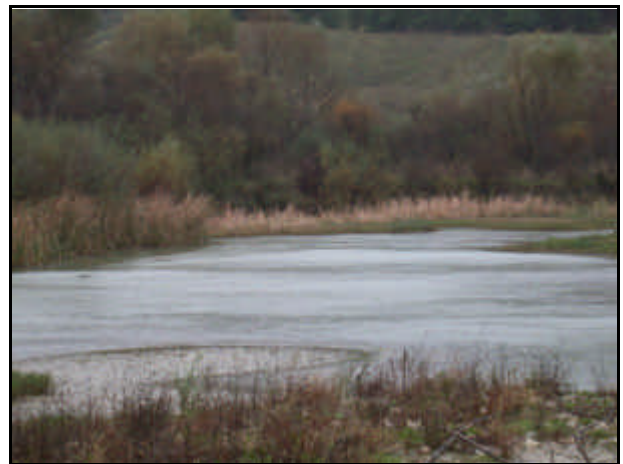
Foce del Fiume Tappino