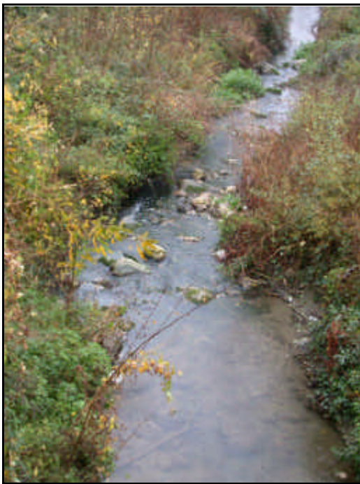
Sorgente del Fiume Tappino

Nasce dal monte La Rocca (m 1000), presso Vinchiaturo. Affluente di sinistra del fiume Fortore di fronte a Poggio Valva. Alle sue sorgenti riceve molti rivi e torrenti, specialmente fra Ferrazzano e Mirabello Sannitico, e riceve molti affluenti durante il suo corso, fra cui i principali sono: a sinistra il torrente Fiumarello e a destra il vallone San Nicola e la fiumara Succida. E' costeggiato dalla strada che unisce Campobasso e Roccapietra alla SS. 212