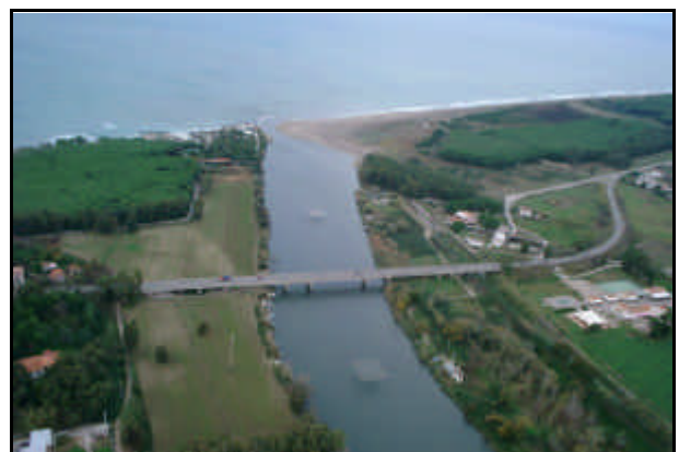
Foce del Fiume Sele