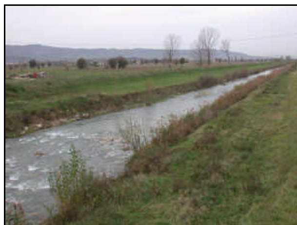
Confluenza con il fiume Topino