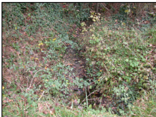
Sorgente del fiume Maroggia

Provincia di Terni e Perugia. Nasce dal monte Vagliamenti (m 936) in provincia di Terni, dove scorre per un breve tratto, passando subito in quella di Perugia. Si unisce al torrente Teverone nella piana fra Foligno e Spoleto. Località: Spoleto.