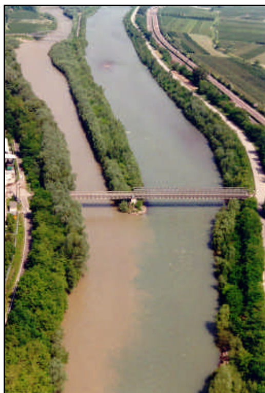
Confluenza nel fiume Adige