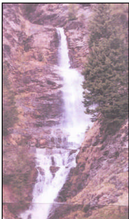
Sorgente del fiume Isarco

Fiume del Trentino-Alto Adige, il maggior affluente di sinistra dell'Adige, nel quale va a gettarsi in corrispondenza della conca di Bolzano; 85 km di lunghezza; bacino: 4.141 km 2 . Nasce a circa 2.000 m d'alt. a ovest del passo del Brennero e scorre quasi sempre in una valle stretta, che si allarga però nelle conche di Vipiteno, Bressanone e Bolzano. Nel corso superiore viene incanalato per 70 m circa in galleria, dove il suo alveo è percorso dalla ferrovia del Brennero. Il suo maggior affluente (di sinistra) è la Rienza, che confluisce a Bressanone. La valle dell'Isarco, che fu abitata fin dall'epoca eneolitica, come dimostrano numerosi ritrovamenti, è una importantissima via naturale di comunicazione con l'Europa centrale. Lungo il corso dell'Isarco sono installate nove centrali idroelettriche, per una potenza complessiva di oltre 380 mila kW, poco meno di un quarto di quella complessiva di tutto il bacino dell'Adige; le centrali principali sono quelle di Cardano (183 mila kW) e di Bressanone (114 mila kW).