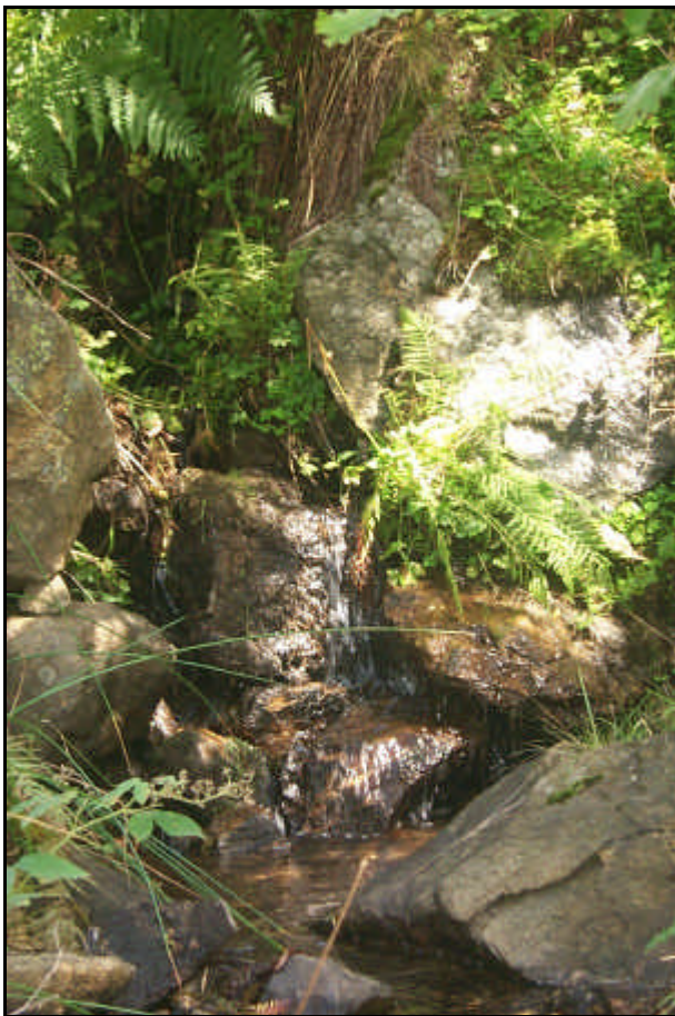
Sorgente del fiume Crati

In latino Crathis, fiume della Calabria settentrionale che nasce dal monte Timpone Bruno nella Sila Grande, scende ripidamente attraverso la valle omonima, bonificata, verso Cosenza, dove riceve il Busento; scorre poi tra la Catena Costiera e la Sila Grande e attraversa la piana di Sibari, dove, a 5 km dalla foce, riceve il suo affluente più importante, il Coscile, e si getta nel golfo di Taranto; 89 km. Costituì nell'antichità il confine tra il Bruzio e la Lucania. Il suo bacino (2.440 km 2 ) alimenta sei centrali idroelettriche aventi complessivamente una potenza di 174.000 kW. La principale è la centrale Mucone - 1° salto, presso Acri, avente una potenza installata di circa 100.000 kW.