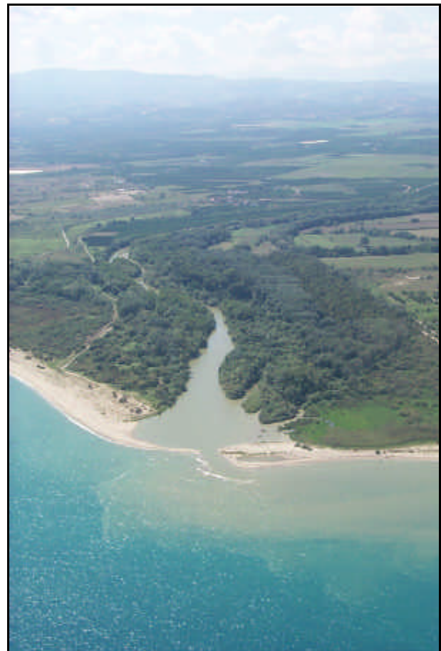
Foce del fiume Crati