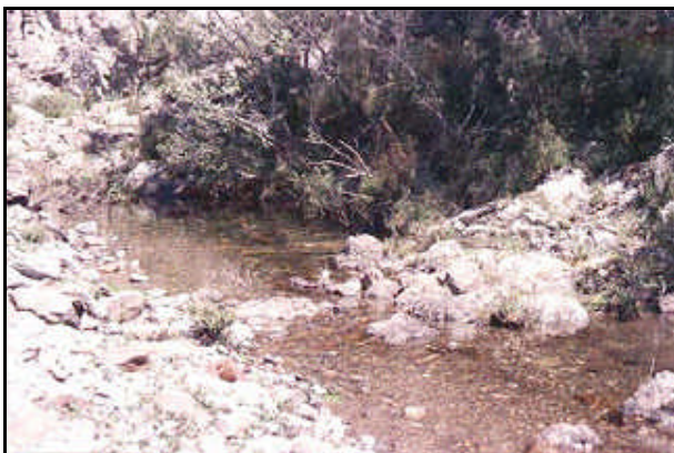
Sorgente fiume Brenta

Il Brenta nasce tra i laghi di Levico e Caldonazzo a 450 m di altitudine ed è lungo quasi 174 km. Nel suo bacino idrografico si possono individuare due parti distinte con una evidente discontinuità tra di loro. Quella montana, infatti, corrispondente grosso modo ai primi 70 km del corso, dall'origine ai pressi di Bassano, è molto estesa ed è attraversata da una fitta rete di affluenti mentre quella meridionale è meno ampia e priva di torrenti importanti. La dispersione sotterranea delle acque, determinata dalla permeabilità dei terreni, riduce la portata del fiume, al suo ingresso nell'alta pianura. Notevole la sottrazione delle acque esercitata dalle rogge. Si riconoscono due periodi di massima (primavera-autunno) e due di minima (primavera- inverno). Il corso del Brenta non si è mantenuto stabile e regolare, nel tempo, ma ha divagato rispetto all'asse dell'alveo di origine, in senso ovest-est. E' uno dei fiumi italiani maggiormente trasformati dall'opera della natura e dagli interventi dell'uomo.