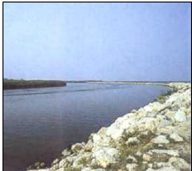
Foce fiume Brenta