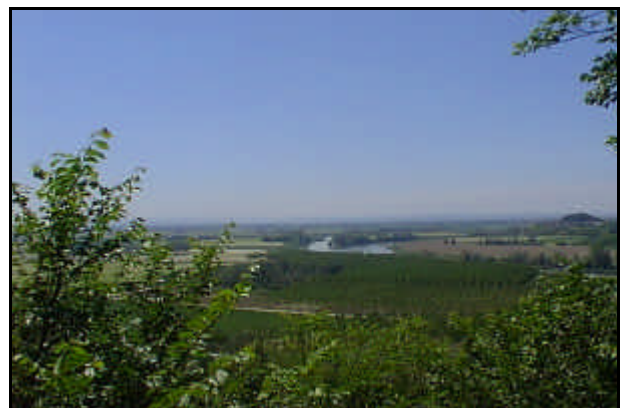
Confluenza nel fiume Tanaro