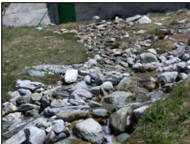
Sorgente del fiume Bormida

Fiume del Piemonte che a valle di Alessandria confluisce nel Tanaro, affluente di destra del Po. Nato fra Monastero e Bistagno, presso Acqui, dalla fusione di due corsi d'acqua provenienti dall'Appennino Ligure, la Bormida orientale o di Spigno o del Cairo (80 km) che scende dal monte Settepani (1.386 m) e la Bormida occidentale o di Millesimo (90 km) che nasce dal monte Carmo (1.389 m), il fiume ha una lunghezza complessiva di circa 150 km. Affluenti principali: i torrenti Erro e Orba. La Bormida segnava un tempo il confine tra il Genovesato e l'alto Monferrato.