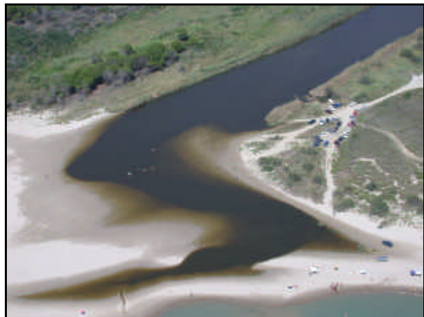
Foce del fiume Basento