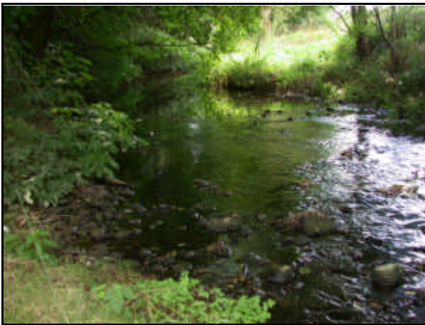
Sorgente del fiume Basento

Fiume della Basilicata che nasce a circa 1.350 m d'alt. dalla Serra del Cerro, scorre presso Potenza e sfocia nello Ionio (golfo di Taranto) a sud di Metaponto; il maggiore affluente (sinistra) è il torrente Camastra di Trivigno; 149 km. Bacino: 1.545 km 2 .