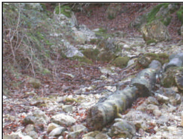
Sorgente del fiume Aniene

Fiume dell'Italia centrale, affluente di sinistra del Tevere; 100 km circa. Nato dal versante meridionale del monte Tarino, nei Simbruini (subappennino laziale), scorre in direzione NO, attraversando Trevi e Subiaco; quindi piega verso SO formando, a valle di Tivoli, le celebri cascate (Grande Cascata: 160 m d'alt., Cascatelle: 96 m), modificate parzialmente per proteggere la città dalle piene provocate dal fiume e utilizzate per una centrale idroelettrica (Castel Madama). È soggetto a periodiche piene (novembre-gennaio e marzo-aprile) e magre (agosto-ottobre). Nel corso inferiore viene denominato Teverone.