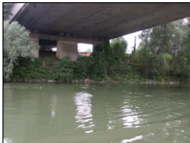
Confluenza nel fiume Tevere